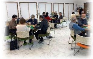
「輝」麻雀の様子です

会員の皆さんが楽しんでクラブ活動を行い、交流の機会が持てることを大切にしています。